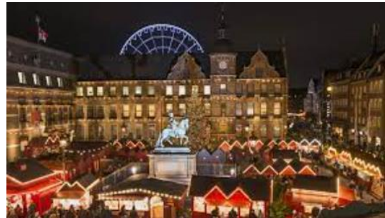
Der Weihnachtsmarkt 2021 am Rathausplatz Düsseldorf lädt zum gemütlichen Verweilen ein.

So kann man ohne große Schwierigkeiten zwischen den unterschiedlichen Märkten in der Stadt pendeln. Auf den Märkten ist mehr Polizei und Sicherheitsschutz unterwegs als gewohnt. Am Wochenende wird die Polizei von holländischen Kollegen unterstützt, da wie in den vergangenen Jahren auch viele holländische Besucher unsere Weihnachtsmärkte genießen.